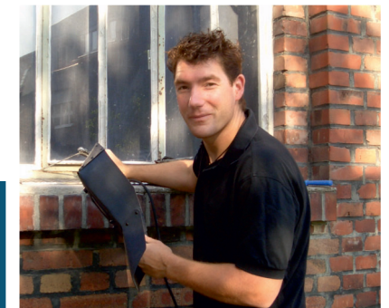
ANPACKEN - im Job, bei kommunalen Projekten und für die Menschen in Herten und Marl